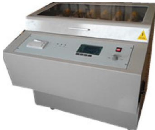
全自动绝缘油介电强度测试仪