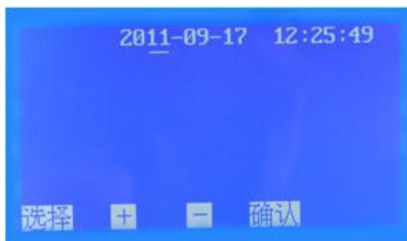
图 5 时间设置子页面

5. 在图 2 页面下，按 选择 键移动光标 \checkmark 至时间设置处，按 确认 键即可进入时间设置子页面（图 5）。