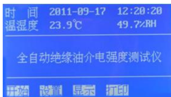
图 1 开机页面