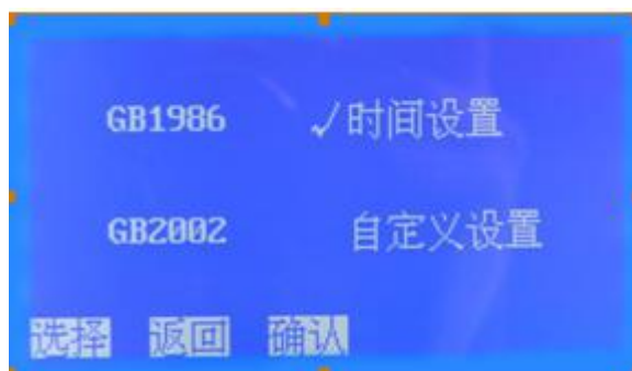
图 2 选择子页面