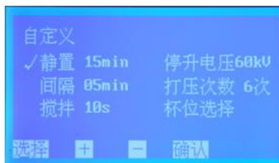
图 6 自定义设置子页面

6. 在图 2 页面下，按 选择 键移动光标 \checkmark 至自定义设置 处，按 确认 键即可进入 自定义设置 子页面（图 6）；